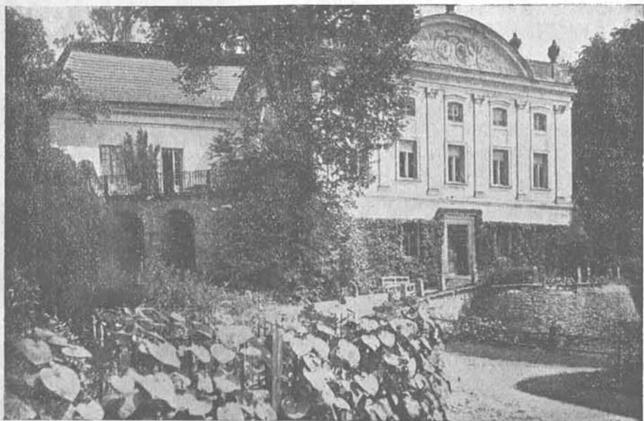
Pałac w Kurozwałkach.

Arianie w okolicy Rakowa. Odpisy dokumentów kościelnych w Kurozwałkach: Opis kościoła w Kurozwałkach. Odpis odpisu dokumentów od SS. Miłosierdzia. Inwentarz z 1781 r. Inwentarz kościoła z 1831 r. Odpis z kopii, znajdujących się w parafii. Odpis bulli papieskiej. Odpisy dokumentów z Kotuszowa i Jasienia. Spis ludności i odmiana nazwisk w Jasieniu. „Przybytni“ i „przychod-